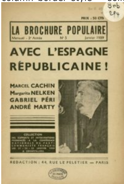
BMP, Pandor, MSH Dijon (cote brb 294)

overflow= »visible » overlay_strength= »0.3" gradient_direction= »left to right » shape_divider_position= »bottom » bg_image_animation= »none »][vc_column column_padding= »no-extra-padding » column_padding_tablet= »inherit » column_padding_phone= »inherit » column_padding_position= »all » column_element_spacing= »default » background_color_opacity= »1" background_hover_color_opacity= »1" column_shadow= »none » column_border_radius= »none » column_link_target= » self » column_position= »default » gradient_direction= »left to right » overlay_strength= »0.3" width= »1/4" tablet_width_inherit= »default » tablet_text_alignment= »default » phone_text_alignment= »default » animation_type= »default » bg_image_animation= »none » border_type= »simple » column_border_width= »none » column_border_style= »solid »][vc_column_text]