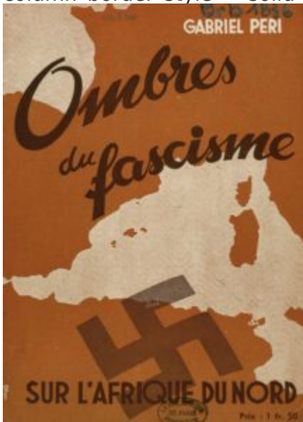
BMP, Pandor, MSH Dijon (cote brb1836)

[/vc_column_text][/vc_column][vc_column column_padding= »no-extra-padding » column_padding_tablet= »inherit » column_padding_phone= »inherit » column_padding_position= »all » column_element_spacing= »default » background_color_opacity= »1 » background_hover_color_opacity= »1 » column_shadow= »none » column_border_radius= »none » column_link_target= » self » column_position= »default » gradient_direction= »left to right » overlay_strength= »0.3 » width= »1/4 » tablet_width_inherit= »default » tablet_text_alignment= »default » phone_text_alignment= »default » animation_type= »default » bg_image_animation= »none » border_type= »simple » column_border_width= »none » column_border_style= »solid »][vc_column_text]