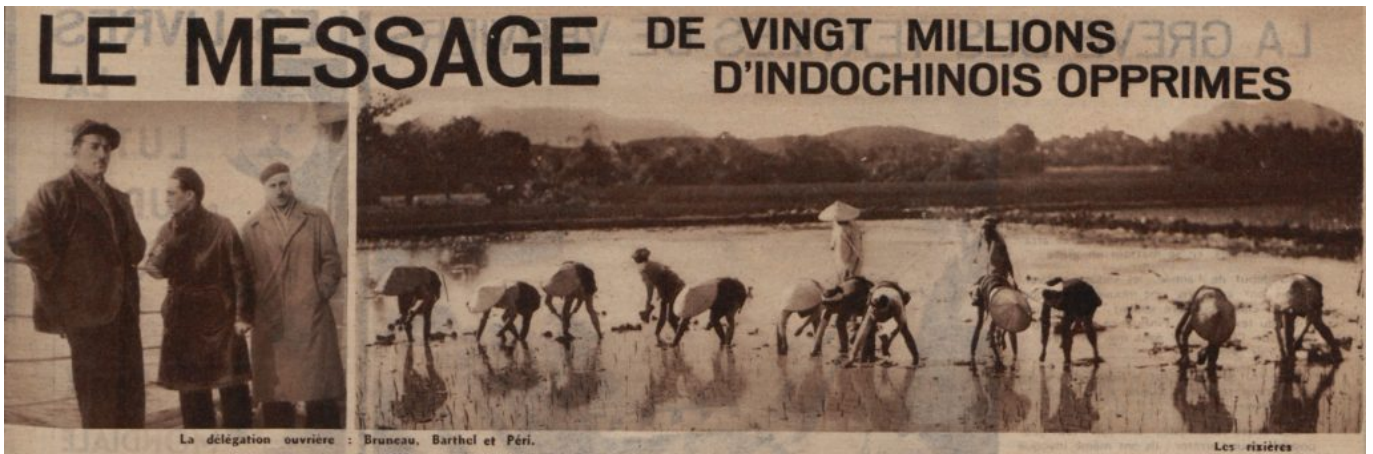
Regards, 27 avril 1934, Gallica BNF

gradient_direction= »left_to_right » overlay_strength= »0.3" width= »1/1" tablet_width_inherit= »default » tablet_text_alignment= »default » phone_text_alignment= »default » animation_type= »default » bg_image_animation= »none » border_type= »simple » column_border_width= »none » column_border_style= »solid »][vc_column_text]