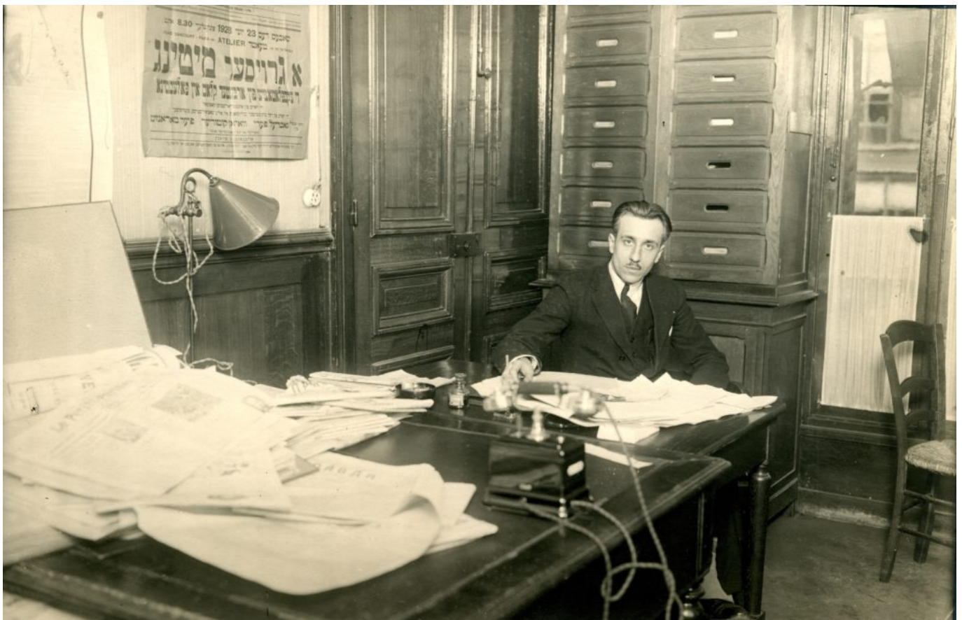
Droits réservés - Mémoires d'Humanité / Archives départementales de la Seine-Saint-Denis (cote 83Fi/482 16)

column_padding_position= »all » column_element_spacing= »default » background_color_opacity= »1 » background_hover_color_opacity= »1 » column_shadow= »none » column_border_radius= »none » column_link_target= »_self » column_position= »default » gradient_direction= »left_to_right » overlay_strength= »0.3 » width= »1/2 » tablet_width_inherit= »default » tablet_text_alignment= »default » phone_text_alignment= »default » animation_type= »default » bg_image_animation= »none » border_type= »simple » column_border_width= »none » column_border_style= »solid »][vc_column_text]