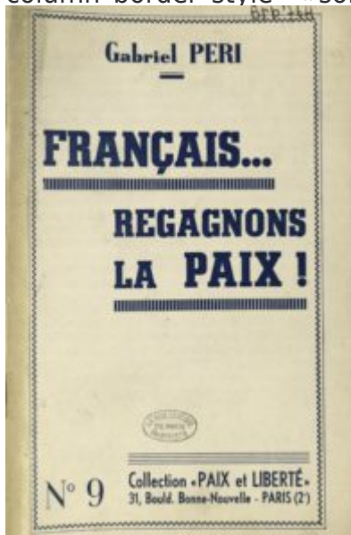
BMP, Pandor, MSH Dijon (cote brb764)

[/vc_column text][vc_column][vc_column column_padding= »no-extra-padding » column_padding_tablet= »inherit » column_padding_phone= »inherit » column_padding_position= »all » column_element_spacing= »default » background_color_opacity= »1 » background_hover_color_opacity= »1 » column_shadow= »none » column_border_radius= »none » column_link_target= » self » column_position= »default » gradient_direction= »left to right » overlay_strength= »0.3 » width= »1/4 » tablet_width_inherit= »default » tablet_text_alignment= »default » phone_text_alignment= »default » animation_type= »default » bg_image_animation= »none » border_type= »simple » column_border_width= »none » column_border_style= »solid »][vc_column_text]