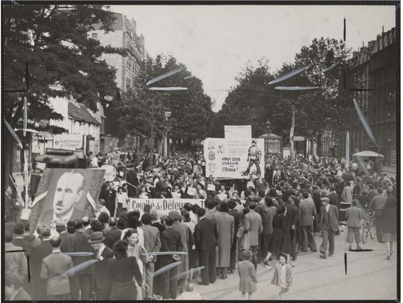
Droits réservés - Mémoires d'Humanité / Archives départementales de la Seine-Saint-Denis (cote 83Fi/258)

[/vc_column_text][vc_column][vc_column column_padding= »no-extra-padding » column_padding_tablet= »inherit » column_padding_phone= »inherit » column_padding_position= »all » column_element_spacing= »default » background_color_opacity= »1″ background_hover_color_opacity= »1″ column_shadow= »none » column_border_radius= »none » column_link_target= » self » column_position= »default » gradient_direction= »left to right » overlay_strength= »0.3″ width= »1/3″ tablet_width_inherit= »default » tablet_text_alignment= »default » phone_text_alignment= »default » animation_type= »default » bg_image_animation= »none » border_type= »simple » column_border_width= »none » column_border_style= »solid »][vc_column_text]